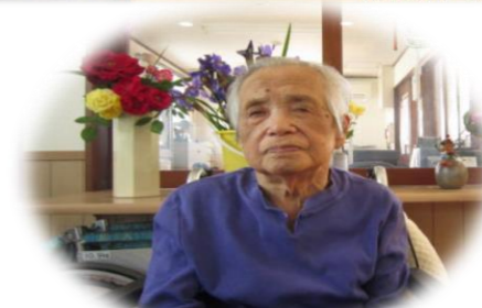
< 今月のクイズ >