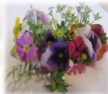
やすらぎの庭に咲いていたお花で「レイ」を作りました