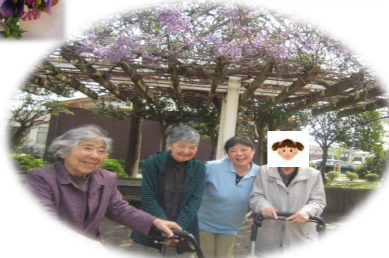
今年は藤の花も少し咲くのが早かったですね