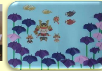
製作：玄関カレンダー