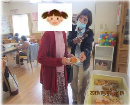
手作りパン。どれにしようか迷っています